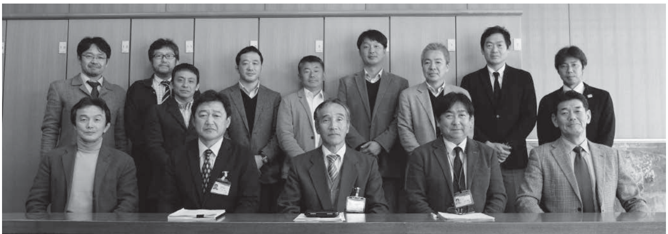
宇城市役所の方々との集合写真

宇城市役所 web サイト http://www.city.uki.kumamoto.jp 2018.2.1 閲覧 市勢要覧2014 http://www.city.uki.kumamoto.jp/q/aview/8/7011.html 2018.2.1 閲覧 気象庁 web サイト http://www.data.jma.go.jp/svd/eqev/data/2016_04_14_kumamoto/index.html 2018.2.1 閲覧