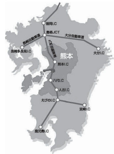
図1 宇城市へのアクセス

教育施設は、小学校13校、中学校5校、生涯学習施設（公民館、図書館、生涯学習センター等）21施設、文化施設（文化ホール、美術館、資料館）は4施設、体育施設は27施設である（配布資料より）。